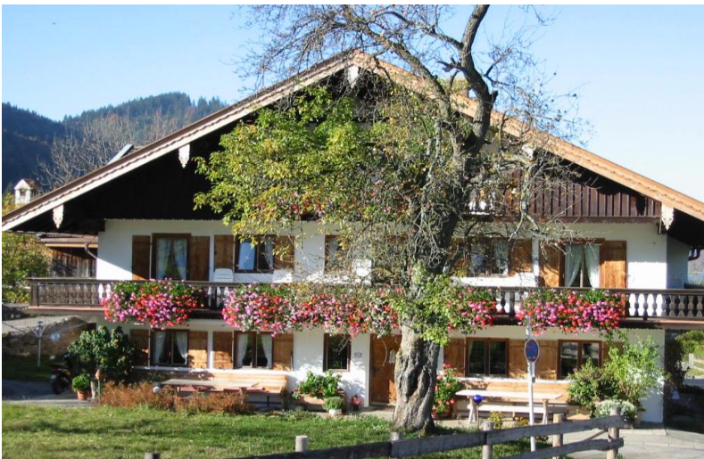
Das Seminarhaus am Schliersee

Anmeldung bis 15. April 2017. Dieses Seminar ist auf max. 10 Teilnehmer begrenzt.